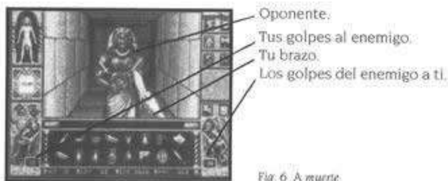
Fig. 6. A muerte.

Cuando estés listo para luchar, el indicador se transforma en una espada. Ahora puedes herirle con cortes o clavarle tu arma, peleando con tu oponente hasta que uno de los dos muera. El lugar en que coloques el indicador al dar el golpe determina si cortas o atravesas la parte del cuerpo que atacas. Por ejemplo, cuando colocas tu arma sobre la parte superior izquierda de la Ventana de Visión y pulsas, el arma acuchilla desde la parte superior izquierda hacia la inferior derecha, haciendo un corte diagonal en el cuerpo de tu enemigo (fig. 5). Además, la parte del cuerpo en la que pulsas puede marcar la diferencia en una lucha: un golpe rápido y bien colocado puede arrancar el brazo de un enemigo, o algún otro miembro de similar capacidad ofensiva.