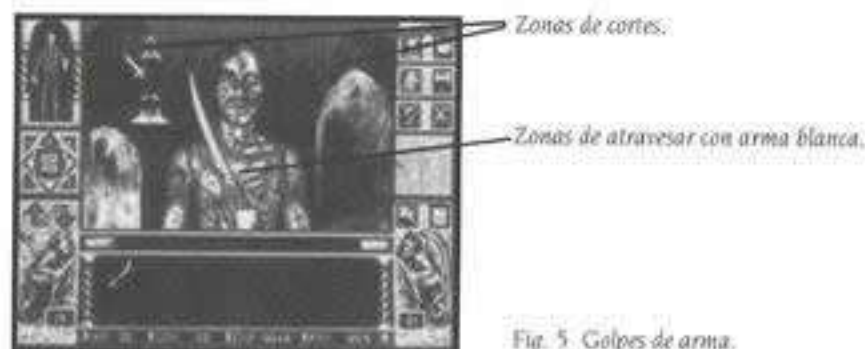
Fig. 5. Golpes de arma.

Cuando estés listo para luchar, el indicador se transforma en una espada. Ahora puedes herirle con cortes o clavarle tu arma, peleando con tu oponente hasta que uno de los dos muera. El lugar en que coloques el indicador al dar el golpe determina si cortas o atravesas la parte del cuerpo que atacas. Por ejemplo, cuando colocas tu arma sobre la parte superior izquierda de la Ventana de Visión y pulsas, el arma acuchilla desde la parte superior izquierda hacia la inferior derecha, haciendo un corte diagonal en el cuerpo de tu enemigo (fig. 5). Además, la parte del cuerpo en la que pulsas puede marcar la diferencia en una lucha: un golpe rápido y bien colocado puede arrancar el brazo de un enemigo, o algún otro miembro de similar capacidad ofensiva.