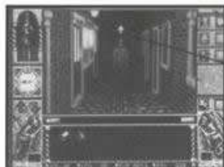
Indicador de dirección